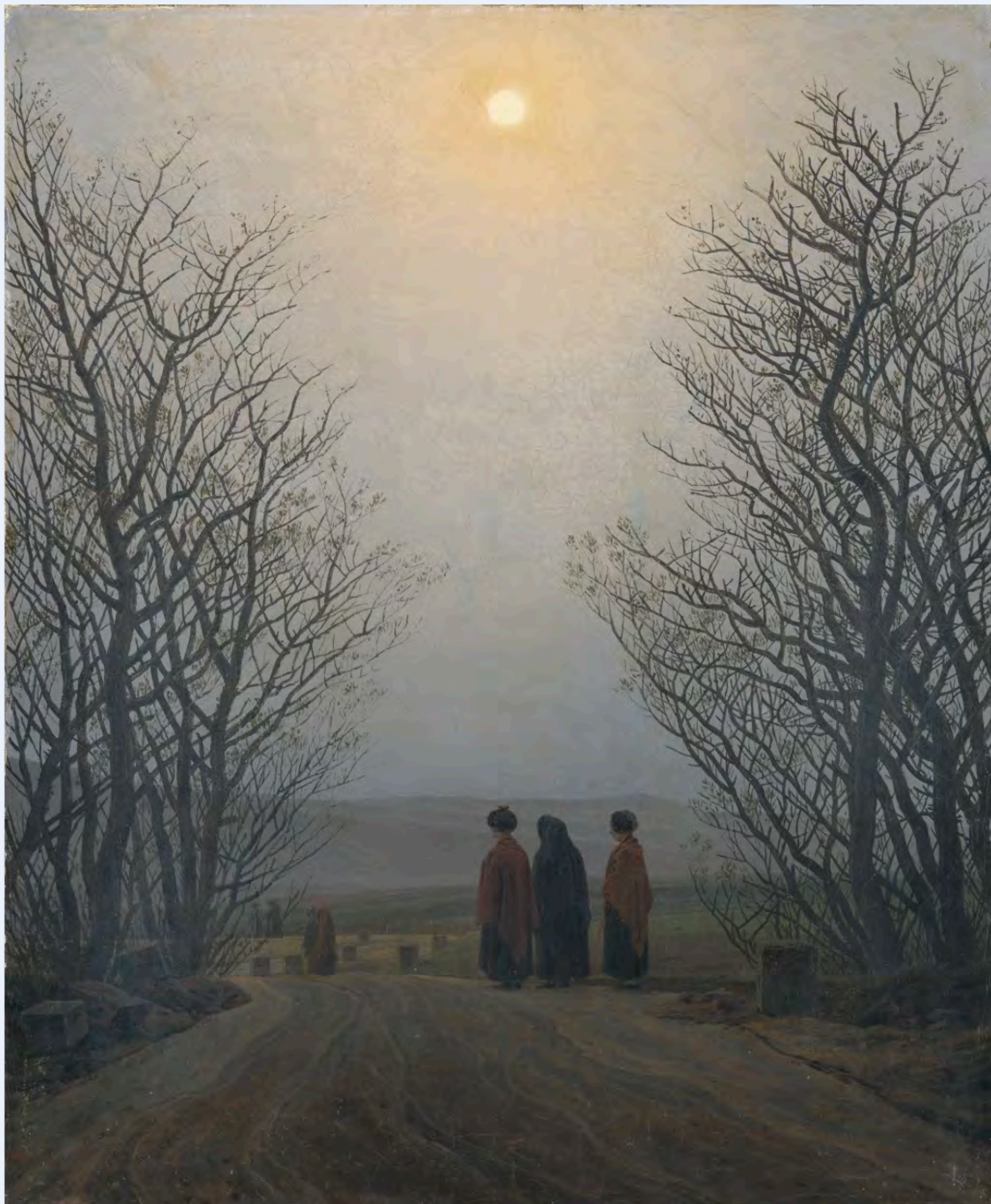
Caspar David Friedrich, Mañana de Pascua , óleo sobre lienzo, Museo Nacional Thyssen-Bornesmez.

En ese contexto, la flor azul deja de ser solo un motivo de la narración para convertirse en un símbolo que el romanticismo hará suyo. En Novalis, amor y poesía confluyen en una misma búsqueda, la de quien intenta conocer el mundo conociéndose a sí mismo.