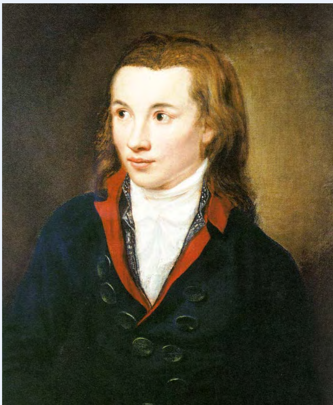
Novalis (1799), retrato de Franz Gareis.

Heinrich von Offerdingen es la novela inacabada que Novalis comenzó a escribir en 1799. En ella hay una escena que marcará buena parte del imaginario romántico. El joven protagonista, figura de la tradición medieval alemana que el romanticismo recuperó, sueña con una flor azul que crece a la orilla de un manantial. La flor se transforma en un rostro humano y ese rostro toma la forma de Mathilde, la mujer amada. No es un sueño cualquiera. Cuando despierta, algo ha cambiado. No sabe qué ha visto exactamente ni puede explicarlo, pero tiene la certeza de que esa flor existe y de que necesita encontrarla. A partir de esa imagen se organiza toda la obra. La Blaue Blume no representa una idea concreta —el amor, la poesía, la naturaleza—, sino el impulso de acercarse a algo que parece quedar siempre un poco más allá. El símbolo se desplaza constantemente y no llega a fijarse. En ese desplazamiento se reconoce su sentido, en lo que no termina de cerrarse del todo.