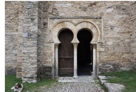
Santiago de Peñalba