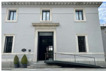
Observatorio Astronómico, Madrid